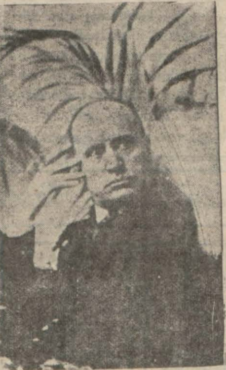
Beyanati mevzubahis olan M. Musolini

Birkaç gün evvel İtalya Başvekilini M. Musolini Türk meb'uslarını kabul ettiği zaman memleketimizle İtalya arasında mevcut dostluktan bahsetti ve muhabhalinin sonunda da: — "İstikbalde iki memleketin iktisadî ve siyasi meseleleri hakkında birliktelik yapacağı fikri vardır, sözlerimin yankısında filiyata inkilâp ettiğini söyleyebilirsiniz." Dedi.