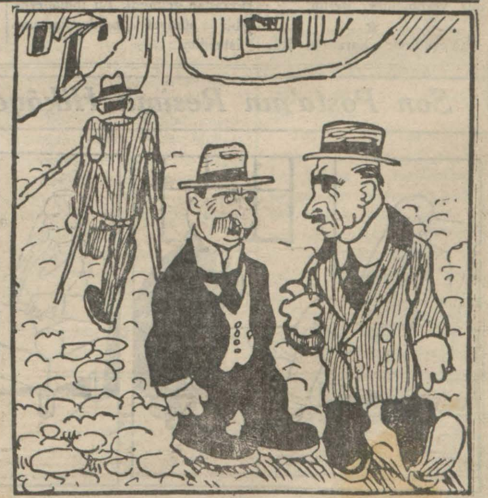
— Zavallı adam, tek bacakla ne zahmetle yürüyor! — Tek firkalı memleketler gibi!